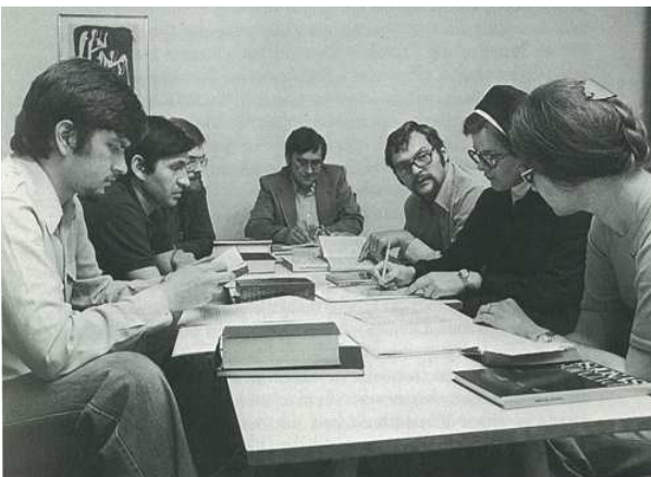
Gruppenarbeit beim Grundkurs von „Theologie im Fernkurs“

nicht nur Priester und evtl. Diakone Träger der Pastoral sind, sondern – und dies nicht nur als „Lückenbüßer“ bei zunehmendem Priestermangel – gerade und manchmal sogar zuerst die Laien. So entstanden neue hauptberufliche pastorale Laiendienste. Zunehmend wurden aber auch verantwortungsvolle ehrenamtliche Dienste von Laien übernommen, etwa in der Gemeindekatechese, in der Jugendarbeit, in der Diakonie, in der Erwachsenenbildung, in der Liturgie. Wie sollten solche Dienste qualifiziert werden? Für hauptberufliche Dienste gab es genügend Ausbildungsstätten. Aber manche Diözesen entdeckten auch hier – wie beim Religionsunterricht –, daß man auf in Beruf und Ehe bewährte Kräfte nicht verzichten sollte, die für eine Vollzeitausbildung nicht mehr in Frage kamen. Natürlich durfte man bei ehrenamtlichen Diensten nicht nur auf den guten Willen und das Engagement setzen. So entwickelte die Domschule einen „Studiengang Pastorale Dienste“. In seiner Vollform kann er zum Dienst von Gemeindeassistent(innen) bzw. -referent(innen) qualifizieren. 9 Er ist jedoch so aufgebaut, daß er in einer Art Bausteinsystem unterschiedlichen Anforderungen, die an ehrenamtliche Mitarbeiter gestellt werden, gerecht werden kann.