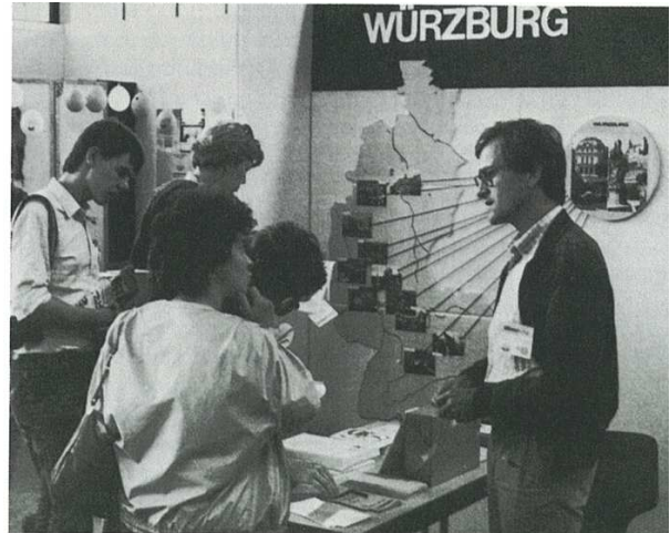
Stand der Würzburger theologischen Fernkurse beim Münchner Katholikentag 1984